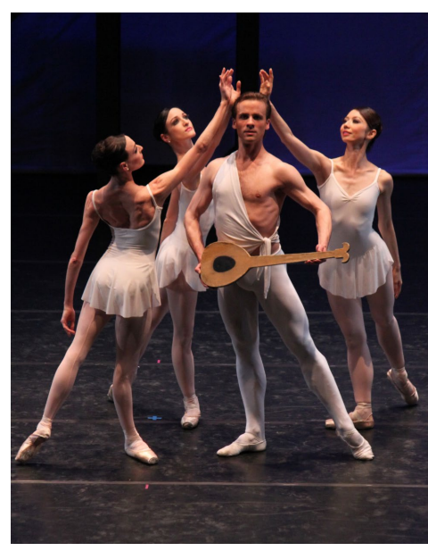
▲ 英国皇家芭蕾舞团在沪演出