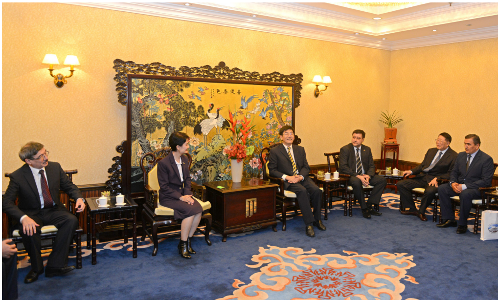
▲上海社会科学院党委书记于信汇(左三)会见乌兹别克斯坦参议院副议长阿尔季科娃·斯维特拉娜·博伊米尔扎耶夫娜(左二)

十八届五中全会明确指出,必须把创新摆在国家发展全局的核心位置,让创新贯穿党和国家一切工作,让创新在全社会蔚然成风。